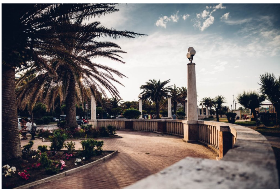
LUNGOMARE MONUMENTALE

Il Comune di Giulianova, nell'ambito dell'iniziativa "Spiagge Sicure - Estate 2020", promossa dal Ministero dell'Interno per la verifica del rispetto delle misure di distanziamento sociale e delle ulteriori prescrizioni contenute nei protocolli o nelle linee guida per prevenire o ridurre il rischio di contagio da Covid-19, ha avviato la campagna di controllo sul litorale giuliese ad opera degli agenti di Polizia Municipale.