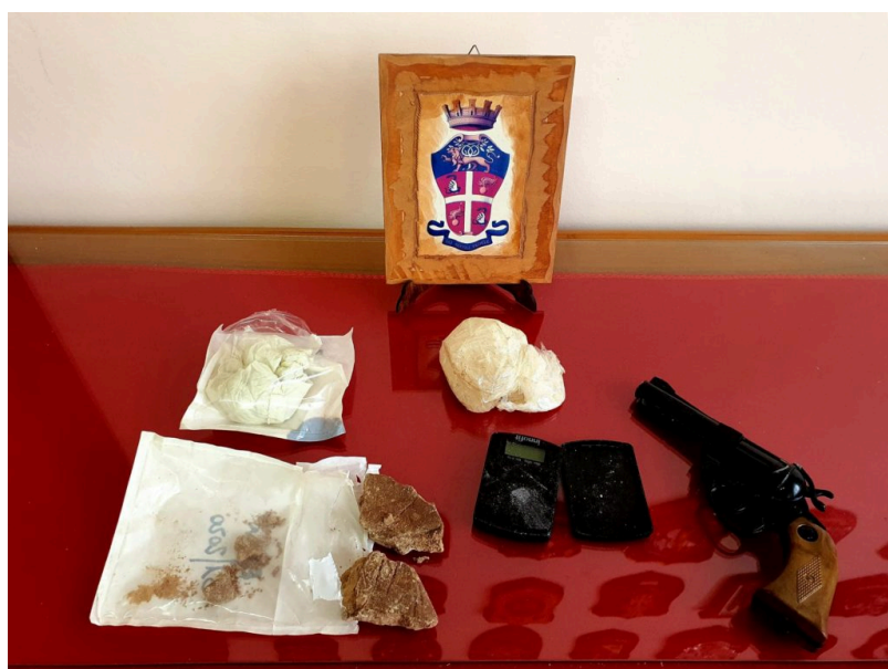
La merce sequestrata a Giulianova

Giulianova. I Carabinieri del Nucleo Operativo di Giulianova hanno arrestato una coppia di coniugi per possesso di droga. L'uomo, durante la precedente operazione di polizia denominata "Scacco al Torrione" condotta dalla stessa Compagnia di Giulianova, il mese scorso, danneggiò il parabrezza della sua auto con una mazza da baseball mentre i militari la stavano