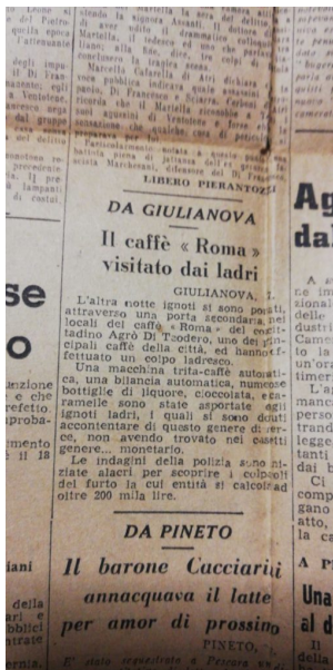
Un vecchio articolo apparso su L'Unità, quotidiano del Partito Comunista Italiano - edizione Abruzzo