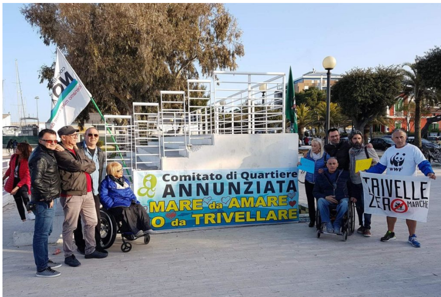
Flash mob 8 aprile comitato annunziata giulianova