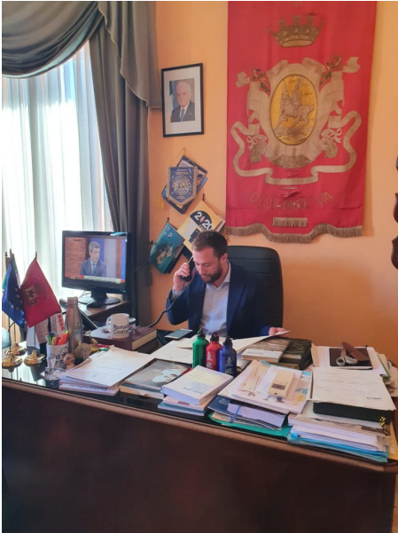
Il Sindaco della Città di Giulianova, Jwan Costantini

La Giunta Costantini sta lavorando per mettere in campo un'iniziativa a favore delle famiglie giuliesi, con la restituzione di una percentuale delle tariffe pagate per il servizio di trasporto scolastico di cui gli alunni, data l'emergenza sanitaria in corso, non hanno potuto usufruire a causa della sospensione delle attività didattiche.