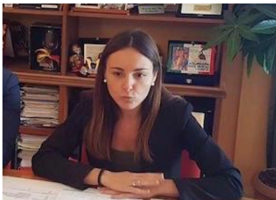
Il Vicesindaco della città di Giulianova, Lidia Albani

Con determina dirigenziale è stato approvato un primo elenco dei nuclei familiari giuliesi in difficoltà economiche che potranno beneficiare dei Buoni spesa, come stabilito dall'Ordinanza n.658 del 29 marzo 2020 del Capo di Dipartimento di Protezione Civile.