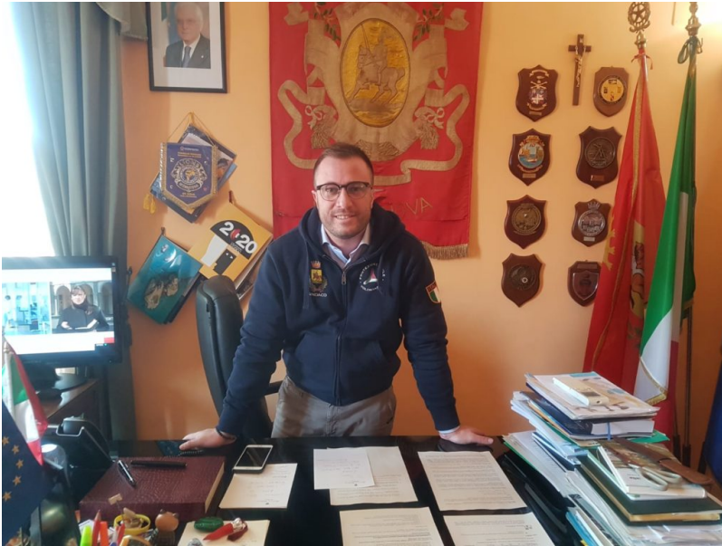
Jwan Costantini, Sindaco di Giulianova

Data l'emergenza sanitaria nazionale e considerate le disposizioni ministeriali sulle misure urgenti in materia di contenimento e gestione del Covid-19, l'Amministrazione Costantini, con delibere di Giunta, ha assunto due urgenti provvedimenti a sostegno dei cittadini e dei dipendenti comunali.