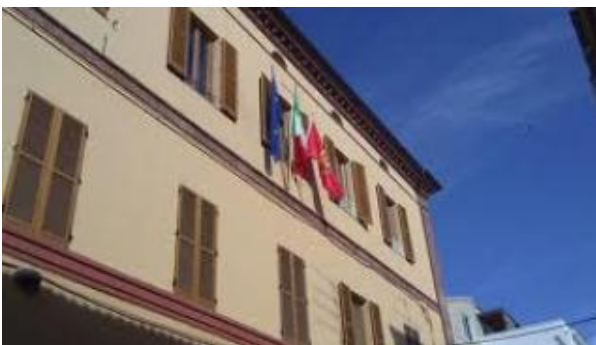
Comune di Giulianova

In esecuzione delle prescrizioni contenute nel DPCM 11 marzo 2020, il Presidente della Regione Abruzzo Marco Marsilio, con ordinanza regionale n. 6 del 13 marzo 2020, ha stabilito che la società TUA Spa e le società concessionarie dei servizi di TPL rimodulino i programmi di esercizio dei servizi di trasporto prevedendo fino al 3 aprile 2020, l’applicazione dell’orario ordinario del periodo non scolastico, ed un’ulteriore riduzione, delle restanti percorrenze chilometriche fino ad un massimo del