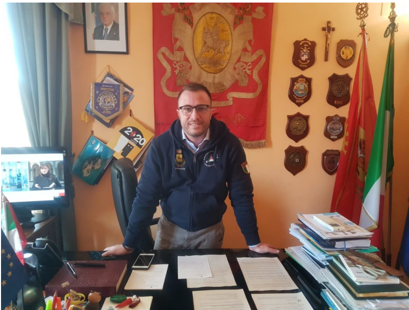
Jwan Costantini, Sindaco di Giulianova

Via al lavaggio ed alla sanitizzazione dei marciapiedi e delle strade sul territorio di Giulianova. Il Sindaco Jwan Costantini, insieme all'Assessore all'Ambiente Giampiero Di Candido, vista l'emergenza sanitaria nazionale in atto, si è prontamente attivato per far partire interventi importanti di sanitizzazione, che riguarderanno dapprima i marciapiedi delle zone più frequentate della città, per poi estendersi alle strade di tutto il territorio comunale, frazioni comprese.