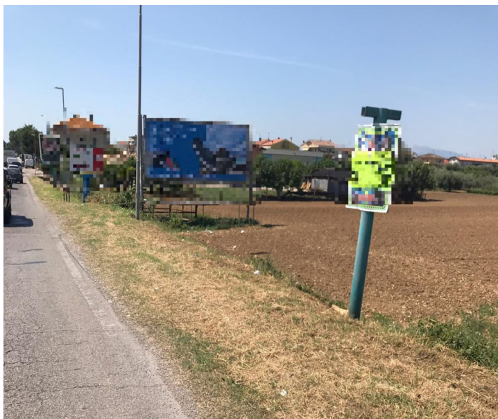
Via Cupa Giulianova

Previsti lavori di asfalto anche per le vie Per Mosciano, Falgioni e Montello