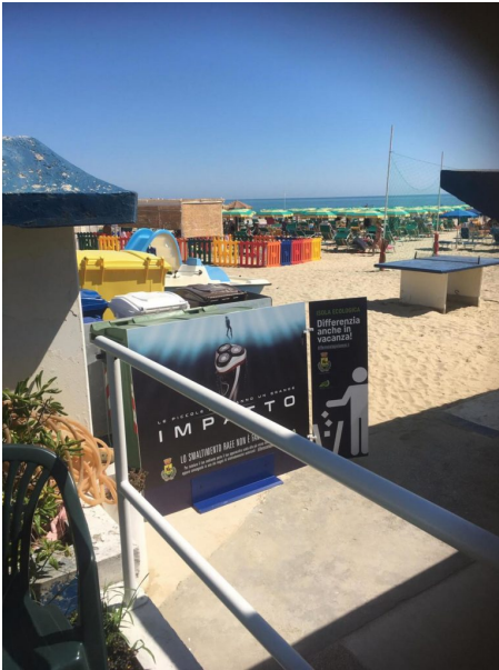
Rifiuti Raee Giulianova

“Con piccoli gesti si possono fare grandi differenze”. E’ questo il messaggio che vuole divulgare a tutti i cittadini, partendo dai più piccoli, la campagna di comunicazione “IMPATTO”, realizzata per il Comune di Giulianova dalla società Eco.Te.Di. Scarl, con lo scopo di sensibilizzare i cittadini sul tema dello smaltimento dei rifiuti di apparecchiature elettriche ed elettroniche, i cosiddetti RAEE e sulle possibili conseguenze del loro abbandono nell’ambiente. La campagna, che si è aggiudicata la vittoria del premio nazionale del Centro di Coordinamento RAEE CDC-RAEE di Milano Eco.Te.Di. Scarl come “miglior campagna di comunicazione locale”, è stata avviata a partire dal mese di giugno scorso ed è articolata in due parti al fine di coinvolgere due differenti tipologie di pubblico. La prima ha l’obiettivo di sensibilizzare i cittadini più adulti sulle possibili conseguenze dell’abbandono indiscriminato dei RAEE nell’ambiente. La seconda si rivolge invece ai più piccoli, con una specifica app che permetterà loro di imparare attraverso un gioco interattivo come smaltire le apparecchiature elettriche ed elettroniche in modo corretto. Nei giorni scorsi è iniziata l’affissione dei manifesti in diversi formati della campagna “IMPATTO” all’intero territorio cittadino, anche negli stabilimenti balneari dove sono stati posizionati nelle isole ecologiche.