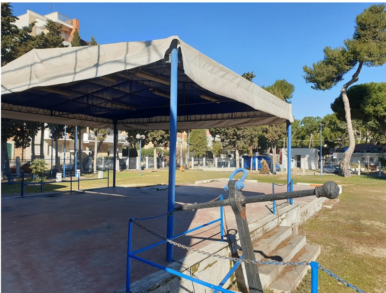
Circolo Nautico Prima sede