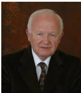
EDEN CIBEJ, giornalista e politico