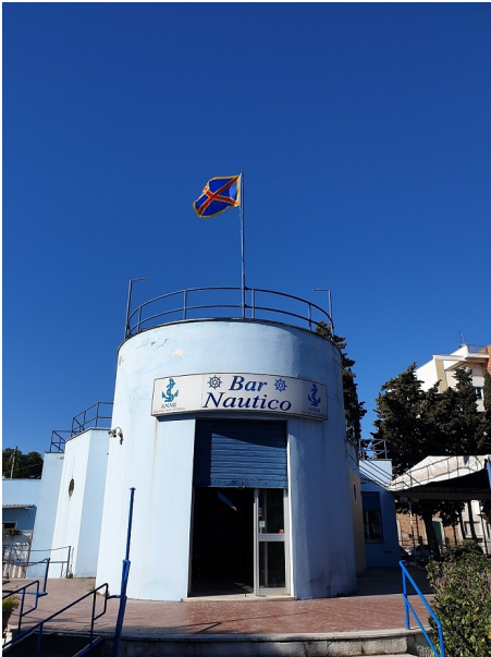
Circolo Nautico Prima sede