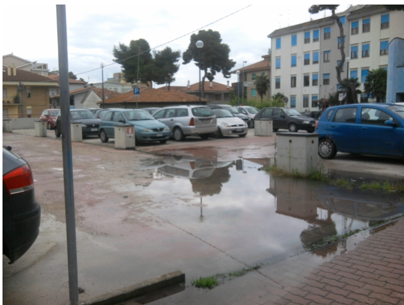
parcheggio via XXIV Maggio davanti Carabinieri

E il 28 marzo, per rifacimento della segnaletica stradale, divieto di sosta nel parcheggio di fronte alla caserma dei Carabinieri