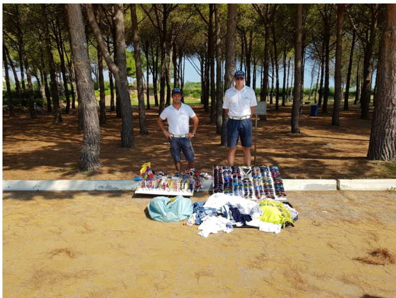
Vigili Urbani di Giulianova merce sequestrata