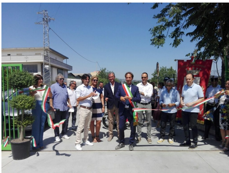
inaugurazione Ecocentro Comunale

I più piccoli, grazie all'iniziativa congiunta Comune-Eco.Te.Di., potranno imparare il valore della raccolta differenziata grazie ad attività e laboratori dedicati.