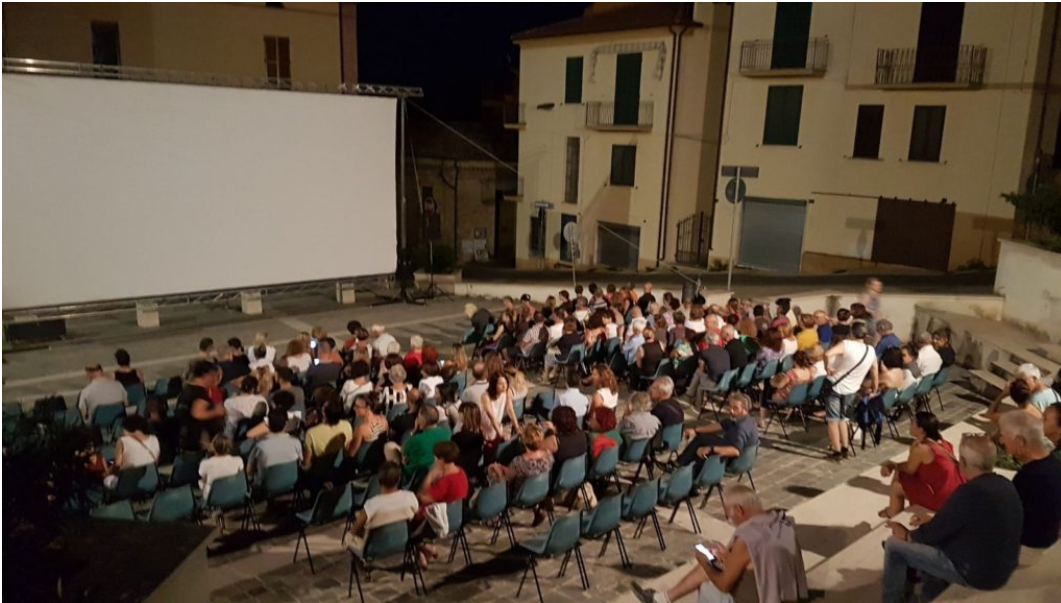
Piazza 29 febbraio 1944 Giulianova cinema

Doppio appuntamento con “Giulianova World Cinema 2018”, la rassegna di cinema all’aperto ospitata in piazza Caduti 29 febbraio 1944, dietro il Palazzo comunale, con inizio alle ore 21.