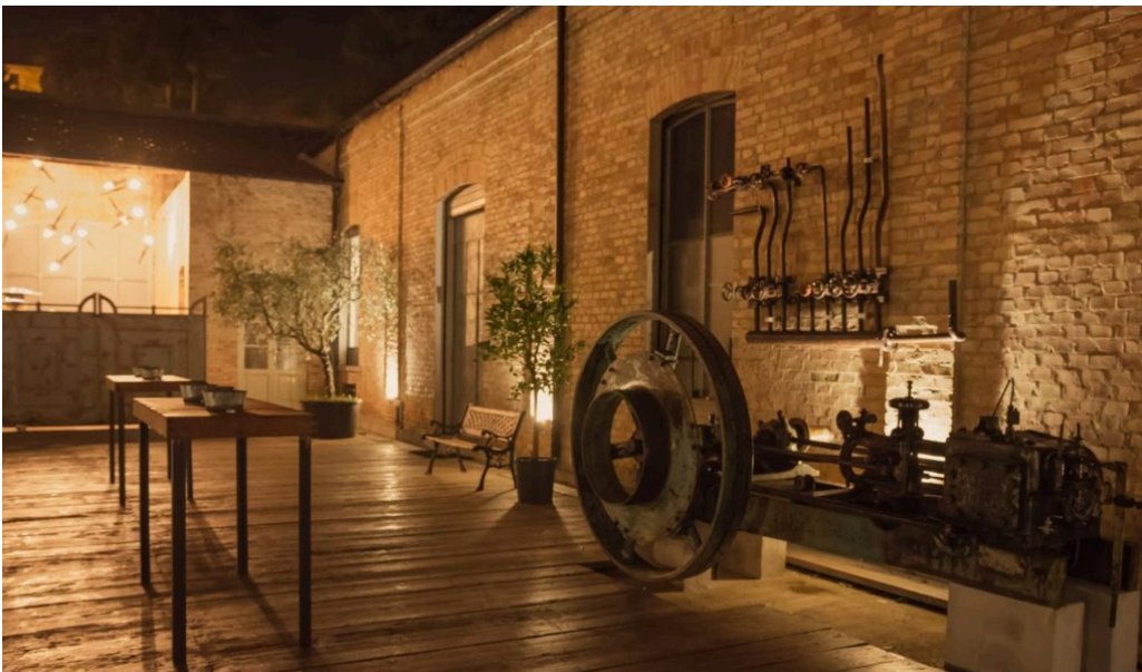
l'ex confettificio Orsini