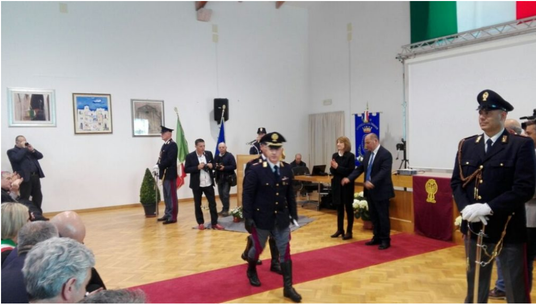
Polizia di Stato