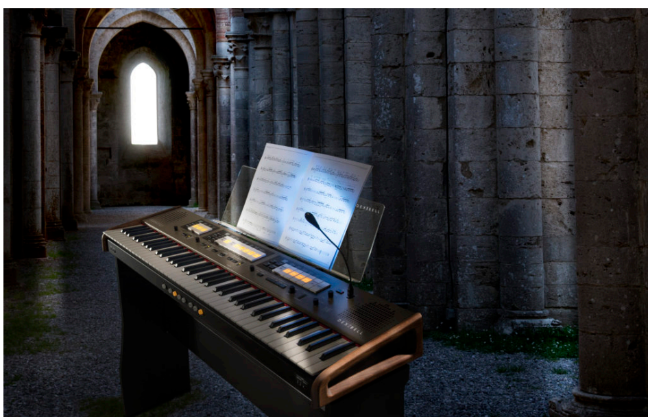
DEXIBELL Organo Digitale Classico L3

I tre obiettivi sono legati con un filo conduttore unico: Prodotto-Mercato; per questo motivo la leva strategica dell'utilizzo di nuove tecnologie è decisiva soprattutto alla presenza di mercati molto specialistici e professionali. Per raggiungere questi obiettivi il team di Ricerca e Sviluppo del Gruppo PROEL ha intenzione di sviluppare una serie di prodotti unici nel settore strumenti musicali digitali del brand DEXIBELL, impiegando la più innovativa e recente tecnologia hardware, non utilizzata dai vari competitors mondiali. Tramite l'utilizzo dell'elevato potere di calcolo, fornito dalla nuova tecnologia, unito a uno SVILUPPO software molto specialistico con l'inserimento di nuove funzioni, PROEL sarà in grado di migliorare sensibilmente la qualità sonora e semplificare il modo di utilizzo di una nuova linea di prodotti denominati VIVO. Il progetto è di fornire al consumatore un nuovo e professionale approccio nel suonare la musica e di non temere comparazioni qualitative di prodotto con altre marchi di strumenti musicali digitali, leva strategica per entrare in un mercato dominante come quello Nord Americano.