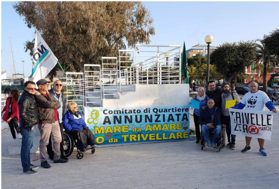
Flash mob 8 aprile comitato annunziata giulianova

La manifestazione contro le trivellazioni ed il progetto air-gun nel mare Adriatico è stata organizzata dal Comitato di Quartiere Annunziata di Giulianova.