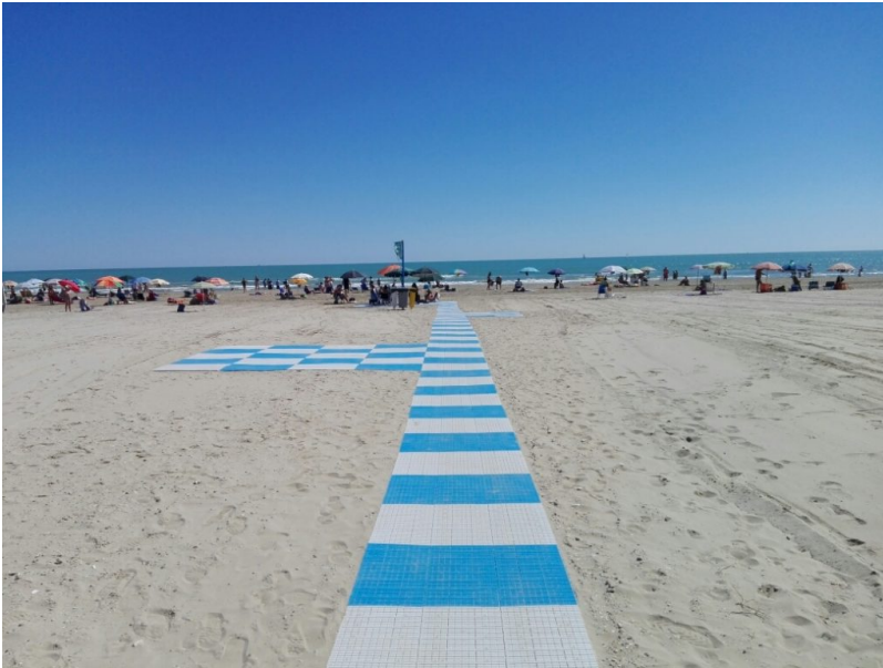
FOTO ARCHIVIO. Spiaggia libera a misura di disabile Giulianova Mare

Gli albergatori teramani, già in grandissima difficoltà a causa degli eventi catastrofici naturali che si sono abbattuti sulla nostra provincia tra i quali la NEVE ed il TERREMOTO che hanno allontanato i turisti dal nostro territorio, devono oggi combattere anche con la concorrenza degli albergatori delle altre provincie italiane. L'unico vantaggio che avevano era quello riguardante la mancata applicazione della tassa di soggiorno da parte dei comuni teramani motivo che ha spinto i turisti a scegliere il nostro territorio. Oggi anche questo vantaggio è svanito per colpa di alcuni comuni (Roseto, Giulianova e forse anche Alba Adriatica) che si preoccupano solo di aumentare le tasse per fare cassa in quanto i soldi non gli bastano mai in quanto, a nostro avviso, il COSTO DELLA POLITICA ITALIANA e del suo GOVERNO è troppo alto e ciò causa una riduzione delle risorse inviate ai Comuni in quanto i Politici non rinunciano alle pensioni da favola che si sono assegnate, ai vitalizi ed alle migliaia di impiegati del Senato e della Camera dei Deputati. Notizia dell'ultima ora: sembrerebbe che vogliano assumere altri 1.500 impiegati che si andranno ad aggiungere ai già tanti impiegati pubblici dei MINISTERI, delle REGIONI, delle PROVINCIE, dei COMUNI ed altri ENTI PUBBLICI, che non stiamo ad elencare, che hanno portato oggi il debito pubblico Italiano ad oltre 2.300 miliardi di euro.