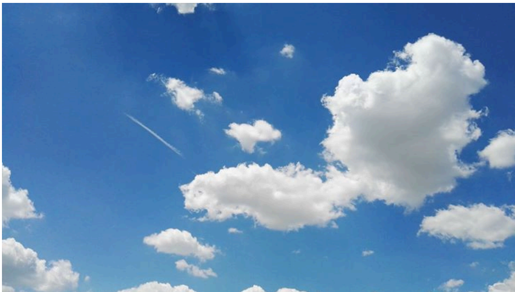
Nuvole - Foto di Walter De Berardinis per giulianovanews.it

Alla fine di una giornata durissima e lunghissima di lavoro qualche semplice annotazione: siamo felici e fieri per la riuscita della Notte Bianca con oltre ventimila presenze, lungomare pienissimo e ricchissimo di attrattive, strade del centro piene e gente che acquistava nei negozi, una scelta musicale di qualità, e per questo ringraziamo tutti gli artisti che hanno partecipato.