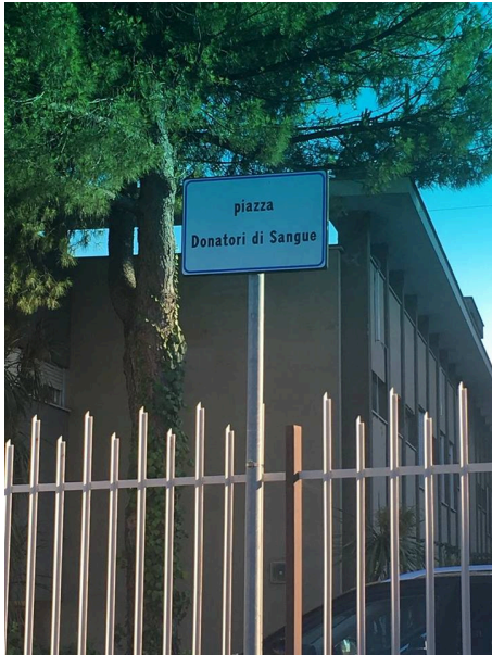
Piazza Donatori di Sangue Giulianova Ospedale