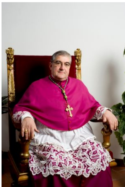
S. E. Mons. Michele Seccia, Vescovo di Teramo

L'invito per un rinnovato impegno sociale e politico dei cattolici, in un tempo di difficoltà e di crisi di valori, al fine di superare la pratica della delega mediante un generoso coinvolgimento.