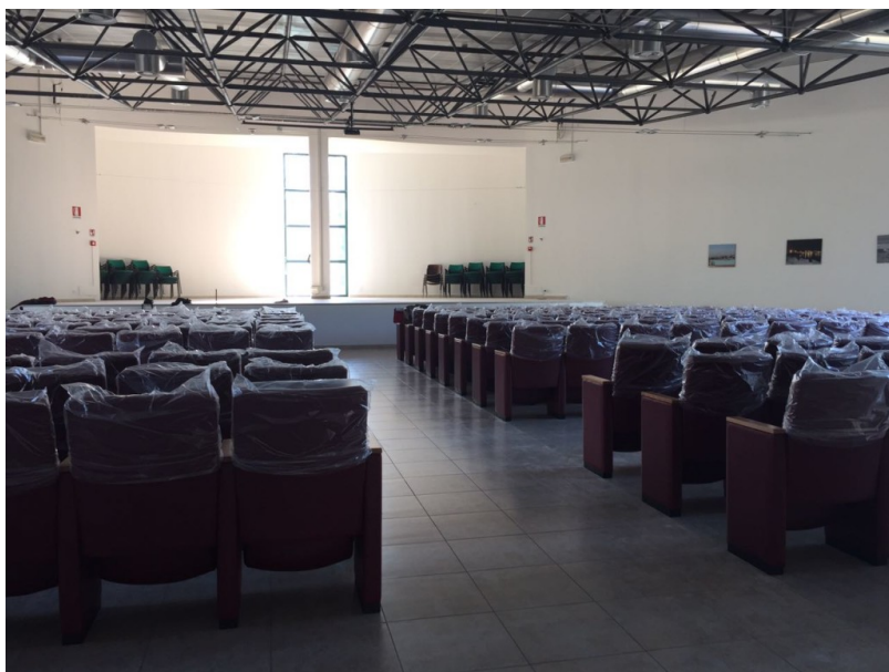
Nuovo Auditorium Centro socio culturale Annunziata

Ultimati nei tempi stabiliti gli importanti interventi sull'auditorium del Centro socio-culturale di via dei Pioppi grazie ad un impegno finanziario complessivo di circa 50.000 euro. Rispettando il cronoprogramma, si è provveduto infatti a risistemare la parte del tetto soggetta ad infiltrazioni d'acqua mediante una nuova guaina impermeabile e, dopo la scarifica dell'intonaco ammalorato, a ritinteggiare le pareti. Particolare attenzione è stata riservata all'Auditorium, completamente ristrutturato e dotato di arredi ed attrezzature fondamentali per la messa a norma e l'adeguamento sotto il profilo dell'antincendio.