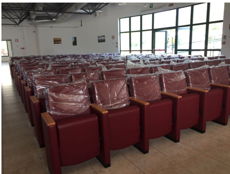
Nuovo Auditorium Centro socio culturale Annunziata