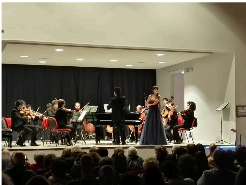
I Sinfonici - Giulianova

Presso il Loggiato Sottobelvedere Piazza della Libertà in Giulianova Paese, si terrà nei giorni 2,3,4 giugno il II° Concorso Nazionale di Esecuzione Musicale “Trofeo Città di Giulianova” suddiviso in due sezioni: una per le Scuole Medie ad Indirizzo Musicale e Licei Musicali, l'altra a Categorie suddivise per età.