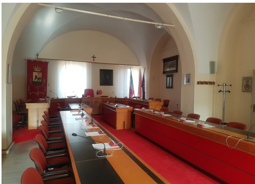
Sala consiliare Comune di Giulianova

Il Sindaco di Giulianova Jwan Costantini saluta il dottor Fabrizio Stelo, nuovo Prefetto di Teramo, ed esprime l'auspicio di un incontro, utile alla costruzione di un duraturo rapporto di reciproca stima e collaborazione.