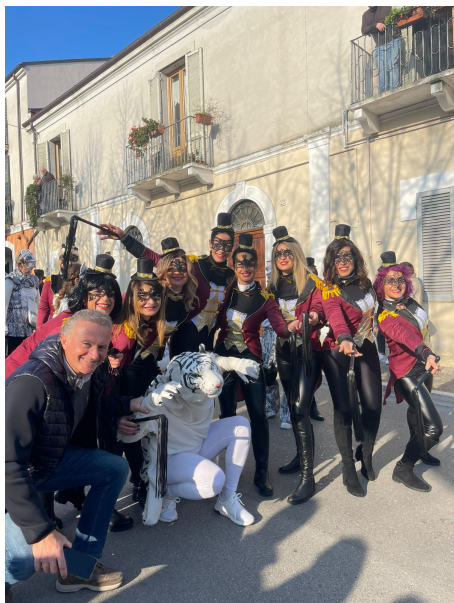
Carnevale 2023