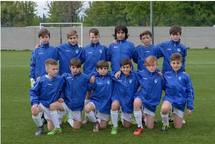
Torneo Della Penna. Delfini Biancazzurri Pescara Calcio 1° Class. Categoria Pulcini Ed. 2016

Premiazione finale il lunedì 1 maggio al campo Castrum / Tiberio Orsini