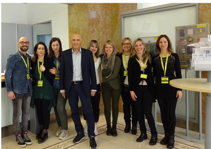
staff up teramo centro

Riconoscimenti per Teramo Centro (via Giacomo Paladini), Giulianova Spiaggia (viale Orsini), Roseto (via Puglie), San Nicolò e Atri