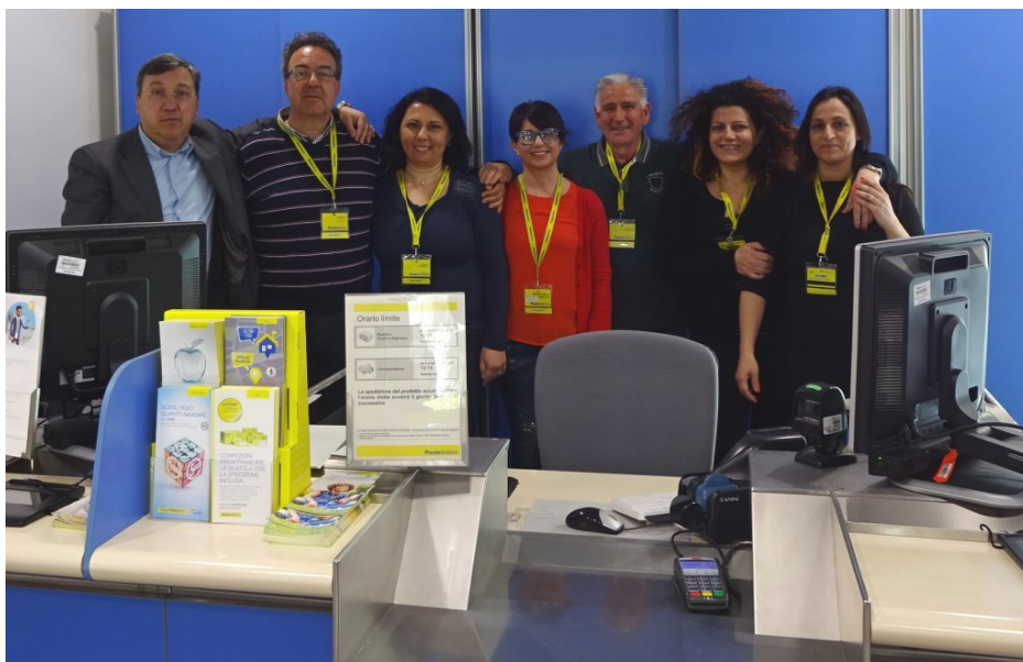
staff up giulianova spiaggia