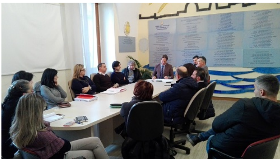
Riunione Scuole Giulianova

In risposta a quanto dichiarato dal Vice Sindaco, e riportato su varie testate giornalistiche, il gruppo dei genitori della Scuola Media Pagliaccetti si sente di replicare quanto segue: