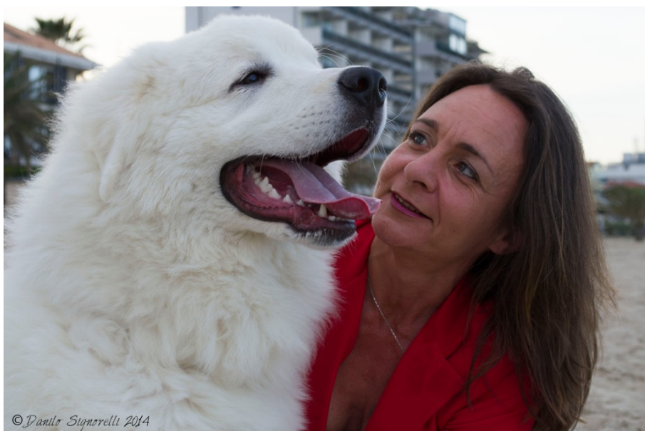
Branella e Golia

L'Abruzzo, una regione provata economicamente e psicologicamente, dagli eventi catastrofici degli ultimi mesi, mostra il proprio orgoglio e forza per reagire alla distruzione naturale.