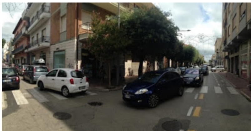
Via Nazario Sauro.

continuino a invadere quel poco spazio riservato alle sempre più numerose bici. Allo stesso modo con il denaro risparmiato si potrebbe intervenire sull'incompiuta di via Nievo, dove uno dei più importanti poli scolastici cittadini soffoca ogni giorno di traffico, avvelenando i più piccoli la cui salute andrebbe invece difesa a ogni costo, perché la strada è oggi interamente dedicata alla mobilità insostenibile.