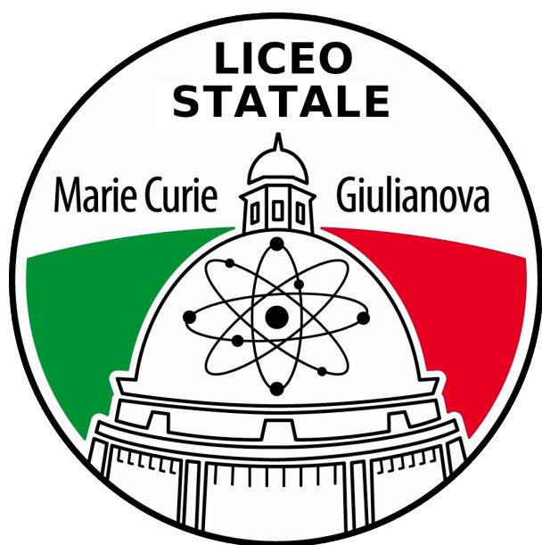
Logo Liceo Curie