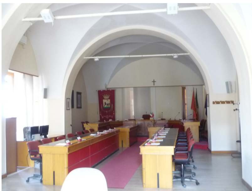
Sala consiliare del Comune di Giulianova