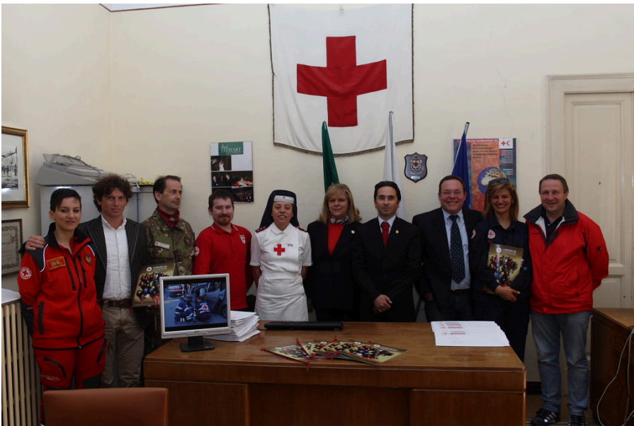
Foto Archivio I Vertici della Croce Rossa Italiana provinciale di Teramo

A Giulianova l'incontro di studio “Per non dimenticare”