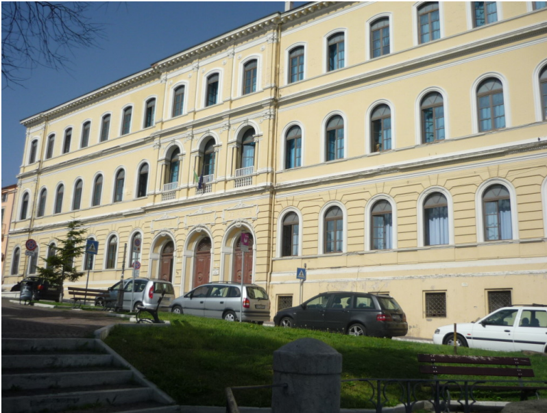
Sede Centrale di Giulianova Circolo 1