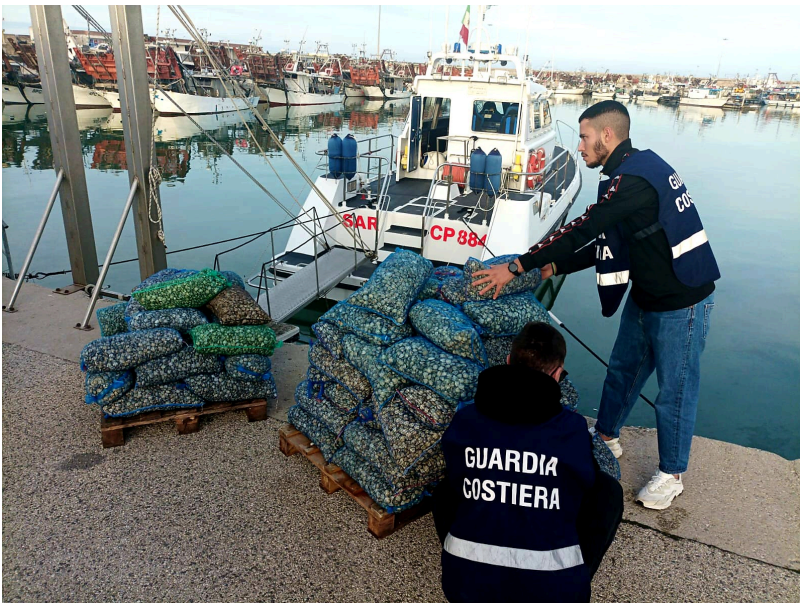
Guardia Costiera Giulianova

È durata tre giorni l'intensa attività di verifica eseguita ad ampio spettro in materia di pesca, navigazione da diporto e sicurezza della navigazione, da parte del personale dell'Ufficio Circondariale marittimo di Giulianova ed in particolar modo dall'equipaggio della motovedetta CP 706.