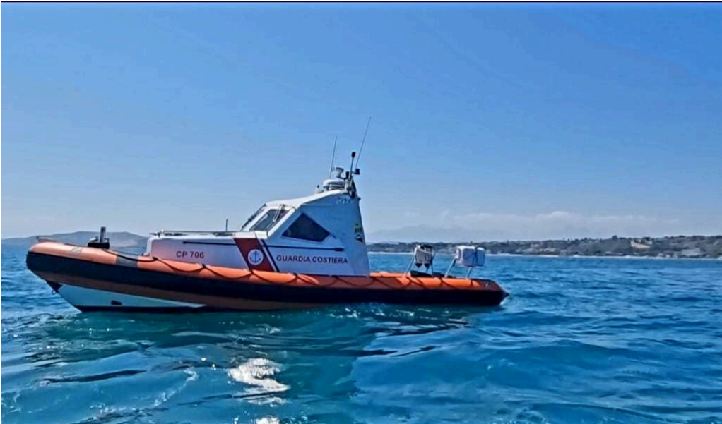
Guardia Costiera Giulianova