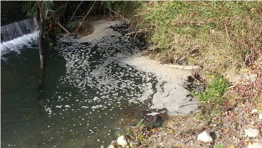
TORDINO FOTO ARCHIVIO