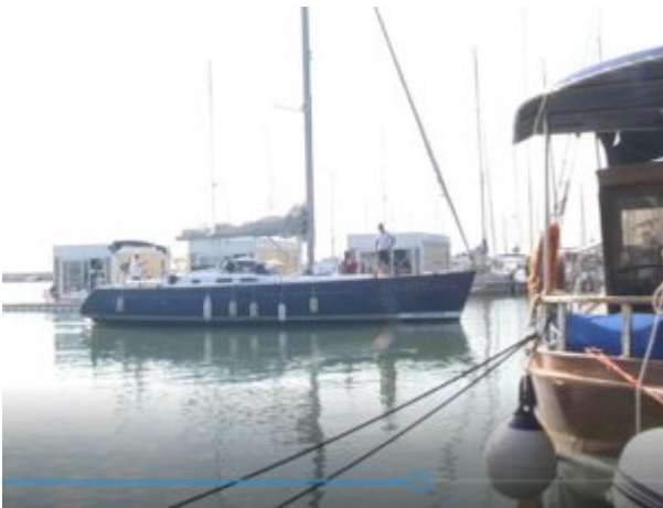
Porto di Giulianova