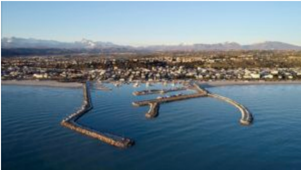
Porto di Giulianova