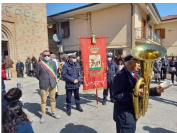
San Giuseppe Colleranesco