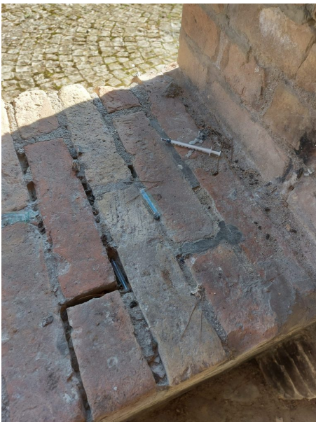
siringhe sulla salita Monte Grappa

Pubblichiamo alcune foto inviate dai nostri lettori sulla presenze di alcune siringhe abbandonate nei pressi delle "fontanelle" lungo la salita Monte Grappa