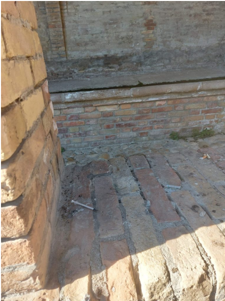
Siringhe sulla Salita Monte Grappa