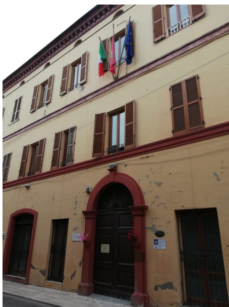
Comune di Giulianova

Termine per la riscossione, il 31 marzo. Gli Uffici comunali della Pubblica Istruzione comunicano che possono essere ritirate le somme relative alle borse di studio per l’ Anno Scolastico 2020/ 2021 erogate dal Ministero dell’Istruzione grazie al Fondo Unico per il Diritto allo Studio. I beneficiari saranno contattati dagli Uffici comunali. Per riscuotere la somma assegnata è necessario recarsi entro il prossimo 31 marzo presso qualsiasi Ufficio Postale senza necessità di utilizzare o esibire la Carta dello Studente IoStudio, ma semplicemente richiedendo all’operatore di sportello di incassare un “Bonifico domiciliato” erogato dal Ministero dell’ Istruzione. Le modalità di riscossione sono altresì specificate dettagliatamente consultando il seguente link: https://iostudio.pubblica.istruzione.it/web/guest/voucher/ Per consultare invece il sito istituzionale del Comune