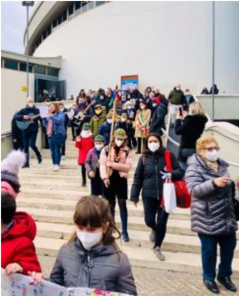
Manifestazione san Pietro 1