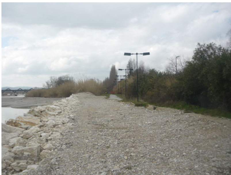
tratto ciclabile Tordino erosa dall'alluvione.