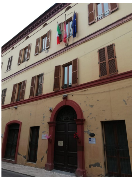
Comune di Giulianova