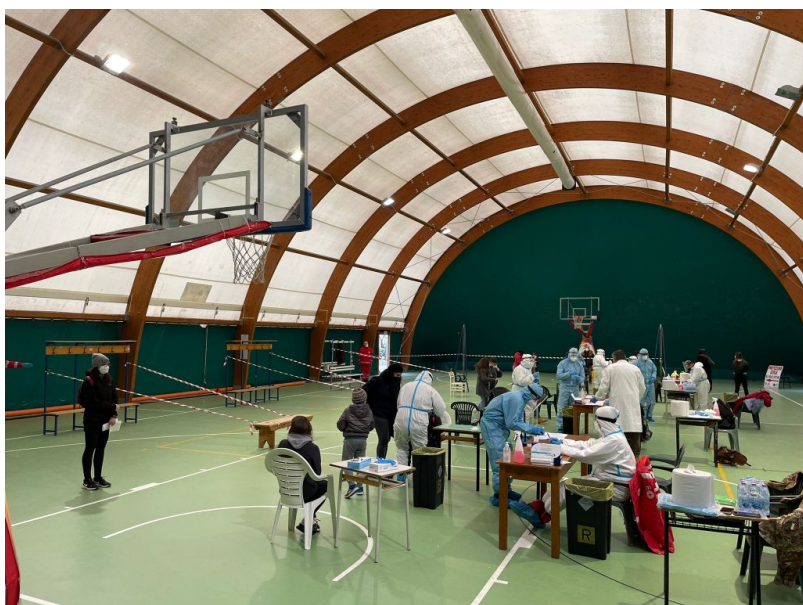
Palacastrum - controlli Covid