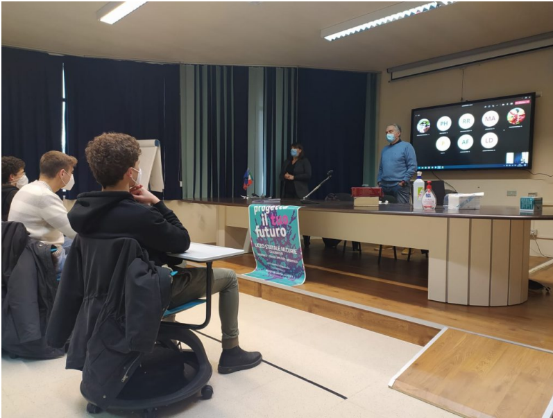
Liceo e Colibrì