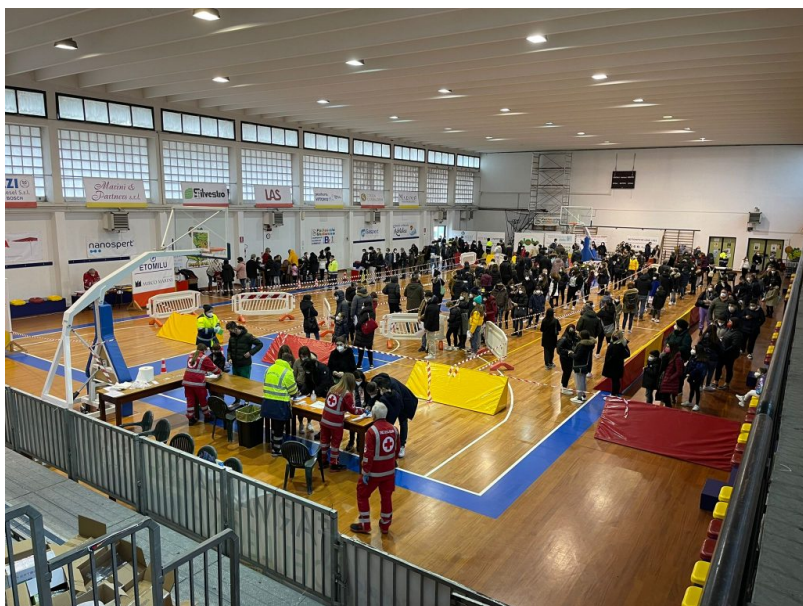
Palacastrum Giulianova controlli covid