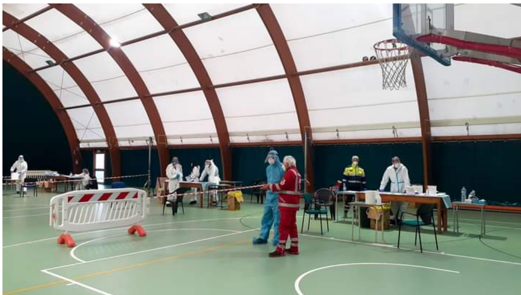
OPERATORI AntiCovid-19

I tamponi gratuiti agli studenti saranno effettuati domenica prossima, 9 Gennaio, dalle 9 alle 20, al Palacastrum. Sarà effettuato domenica prossima, 9 Gennaio, al Palacastrum di via Treviso, lo screening sanitario rivolto agli studenti giuliesi. Dalle 9 alle 20, potranno effettuare il tampone gratuito per l'individuazione dei contagi da Covid 19, i bambini e i ragazzi frequentanti le scuole Elementari, Medie e Superiori di Giulianova. Necessario avere con sé la tessera sanitaria ed il modulo scaricabile sul sito istituzionale del Comune, raggiungibile cliccando su https://www.comune.giulianova.te.it/area_letturaDocumento/132/pagsistema.html