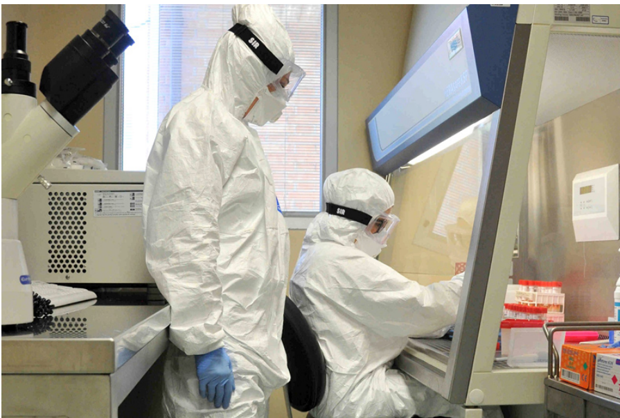
Attività_Covid-19_Virologia_IZSAM Covid-19

Possibile vaccinarsi anche nel giorno dell' Epifania. Aperta la piattaforma per prenotare una somministrazione nell'hub "I Pioppi" di Giulianova per giovedì 6 Gennaio.