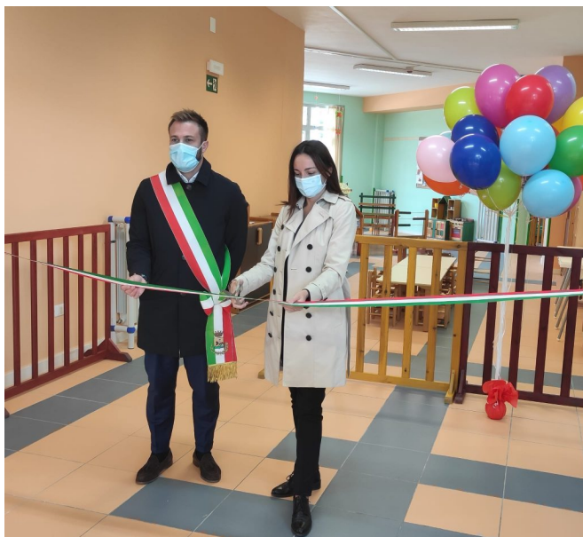
Riapertura Asilo nido Le coccinelle 2021