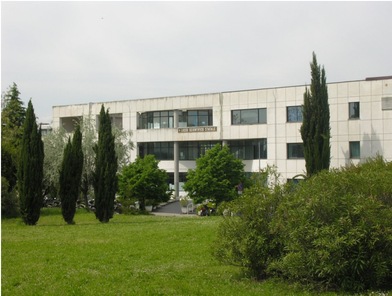
la sede Liceo Scientifico Marie Curie di Giulianova.