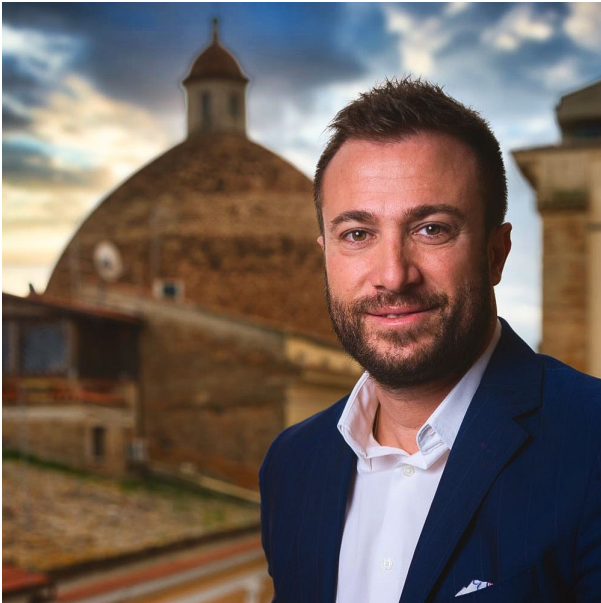
Jwan Costantini, Sindaco della Città di Giulianova.