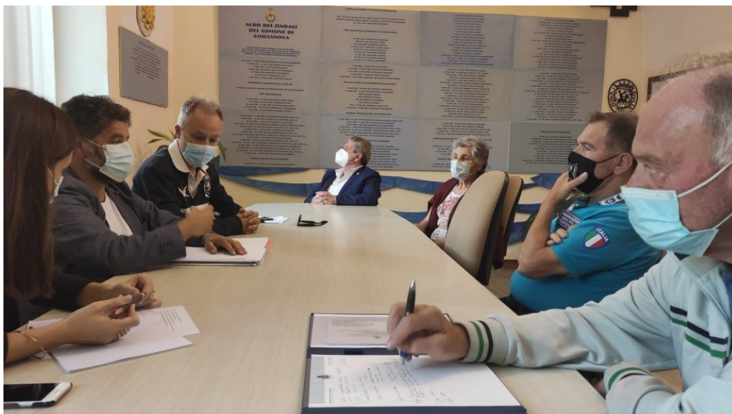
Riunione 4 novembre 2021