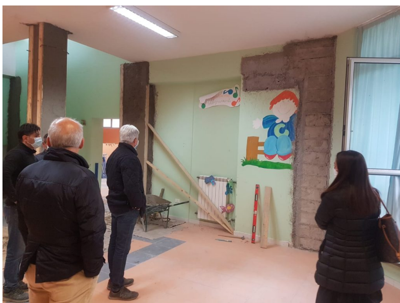
sopralluogo cantiere asilo nido le coccinelle.

A causa delle avverse condizioni atmosferiche, che già nella giornata odierna stanno procurando forti disagi alla circolazione stradale, la cerimonia di inaugurazione del rinnovato Nido “Le Coccinelle” è rinviata a data da destinarsi.