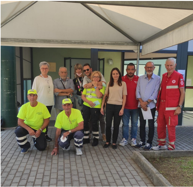
Foto chiusura centro vaccinale