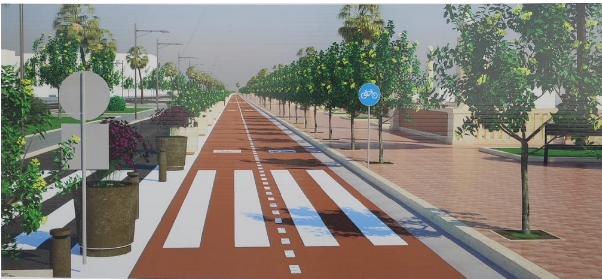
Rendering lungomare centrale

L'amministrazione comunale precisa di non aver rinunciato alla pedonalizzazione, ma di voler procedere per stralci, in attesa della disponibilità di fondi. Nel corso di una riunione tenutasi nelle scorse ore, la maggioranza amministrativa ha