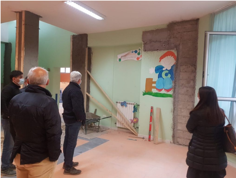
sopralluogo cantiere asilo nido le coccinelle.

L'inaugurazione del nuovo Asilo Nido "Le Coccinelle" di via Alleva, prevista per domani, 6 Ottobre, alle ore 11.30, è stata rimandata per sopraggiunti impegni istituzionali a venerdì, 8 Ottobre, alle ore 8.30.