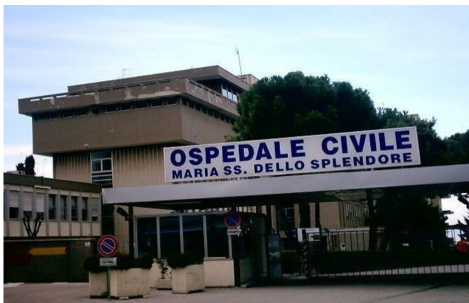
Ospedale Civile

Sapete che sabato 2 ottobre abbiamo organizzato un corteo a difesa dell'ospedale di Giulianova.