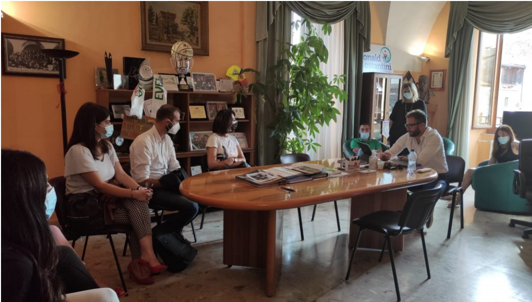
nuovi dipendenti del Comune di Giulianova