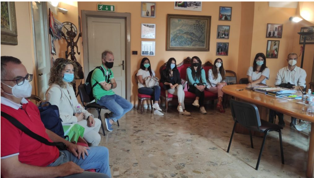
nuovi dipendenti del Comune di Giulianova