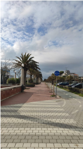
Lungomare di Giulianova