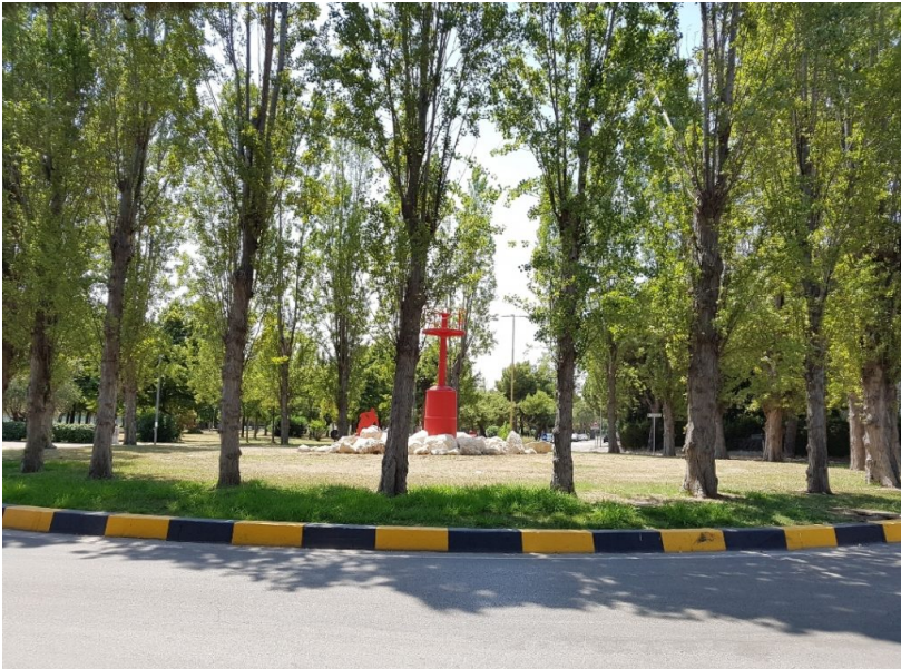
Annunziata Rotonda con faro

GIULIANOVA - Il Comitato di Quartiere Annunziata, insieme ad alcuni genitori che frequentano il parco con i loro figli, ha organizzato per venerdì 10 settembre una giornata ecologica per la raccolta dei rifiuti al Parco dell'Annunziata.