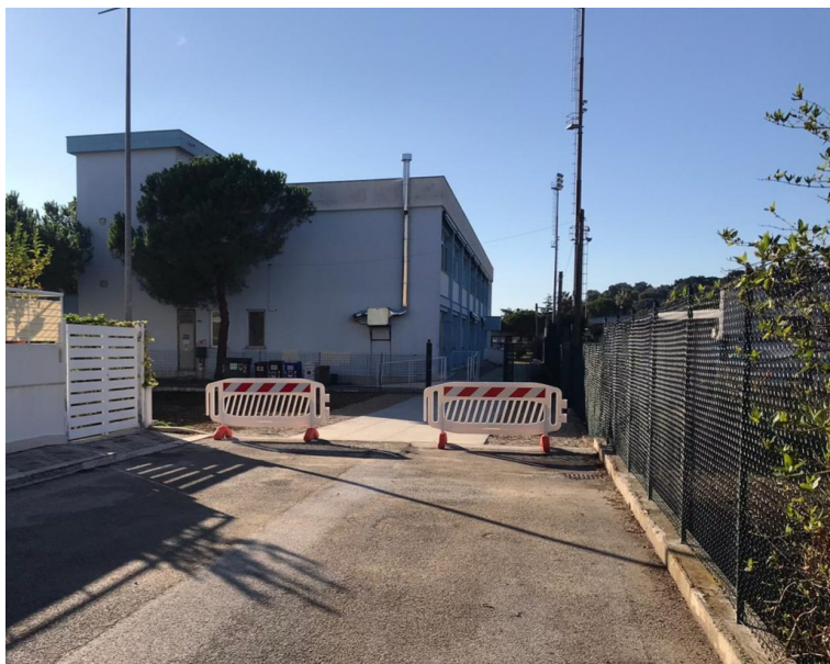
Don Milani Giulianova . Foto ARCHIVIO