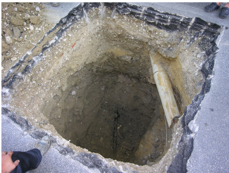
Un tratto di Via Montello

Con due distinte determinazioni dirigenziali, sono stati affidati gli incarichi professionali per la progettazione definitiva ed esecutiva di due fondamentali opere pubbliche. La prima riguarda la canalizzazione delle acque bianche in via Montello e via Bertolino. I lavori, dell'importo presunto di 280.000 euro, consentiranno la salvaguardia dell'abitato di via Parini che, posto in posizione sensibile, risente spesso, negativamente, delle conseguenze del non ottimale deflusso delle acque piovane. Aggiudicata anche la progettazione definitiva per quanto concerne l'adeguamento sismico e la ristrutturazione della Scuola elementare e Media dell' Annunziata. L'intervento, che riqualificherà in maniera significativa l'edificio, si avvale di un contributo ministeriale di 85.000 euro.