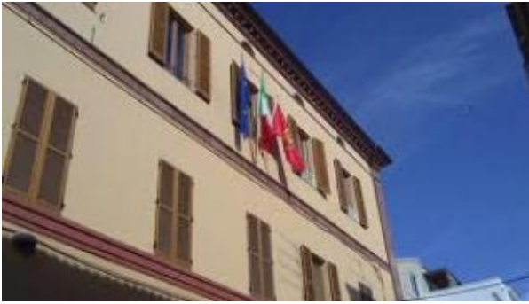
Comune di Giulianova

Si procede lunedì notte al Lido e al Paese, martedì nelle frazioni. La campagna di disinfestazione anti zanzare prosegue anche dopo i mesi più caldi. La ditta incaricata procederà con le operazioni di eliminazione degli insetti adulti nella notte tra lunedì e martedì, 6 e 7 Settembre, nei quartieri Lido e Paese. Le frazioni saranno interessate dallo stesso intervento nella notte successiva, ovvero tra martedì 7 e mercoledì 8 Settembre. Si rinnova l'invito a mettere in atto le consuete precauzioni: non sostare in ambienti aperti durante e dopo il trattamento, tenere le finestre chiuse e gli animali domestici riparati, evitare di stendere la biancheria e di parcheggiare i propri veicoli in modo inappropriato, ostacolando le operazioni di disinfestazione. Gli interventi avranno inizio alle 23.30 circa.