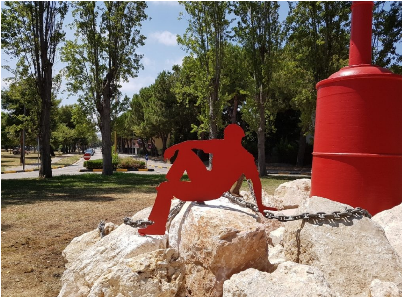
Annunziata Rotonda con faro

Mercoledì 1° settembre cerimonia di inaugurazione del faro nella rotonda di via Di Vittorio