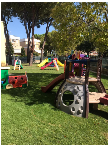
Giulianova, giardino Via Mattarella

L'affidamento garantirà il servizio nelle scuole dell' Infanzia e Primarie fino al 2026. Invariato, per le famiglie, il costo dei buoni pasto. E' da oggi consultabile sul sito istituzionale del Comune, e sarà a breve pubblicato sulla Gazzetta Ufficiale, il bando relativo al servizio mensa nelle scuole dell' Infanzia e nelle Primarie giuliesi. L'affidamento sarà valido a partire da questo anno scolastico fino al 2026. Il valore complessivo dell'appalto posto a base di gara è di 2. 838.525 euro, Iva e oneri inclusi. Il servizio di refezione avrà come utenti gli alunni, gli insegnanti ed il personale Ata delle scuole dell' Infanzia di Colleranesco, via Gobelli, Annunziata e Don Milani e delle Primarie Braga e Don Milani. Attraverso l' appalto pubblico, si ritiene possa essere assicurata una gestione efficace ed efficiente, rimanendo comunque assegnato all'amministrazione comunale un ruolo fondamentale di indirizzo e controllo del servizio. Invariate le tariffe: le famiglie non troveranno dunque sorprese, quest'anno, nell'acquisto dei buoni pasto.