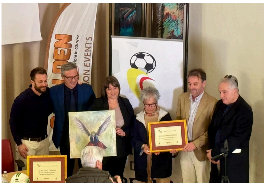
Torneo Emilio Della Penna 2024