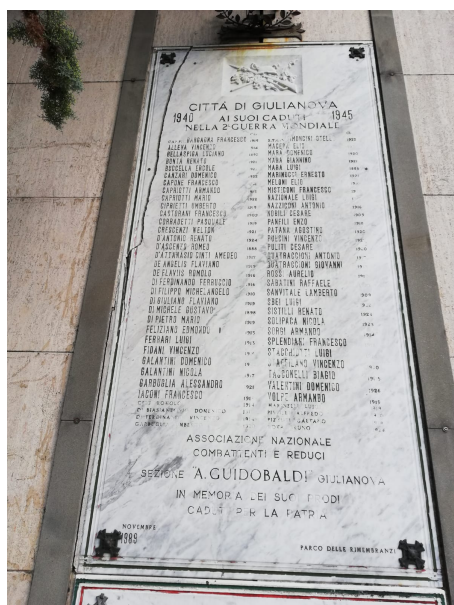
Monumento ai caduti Seconda Guerra Mondiale (cimitero di Giulianova)