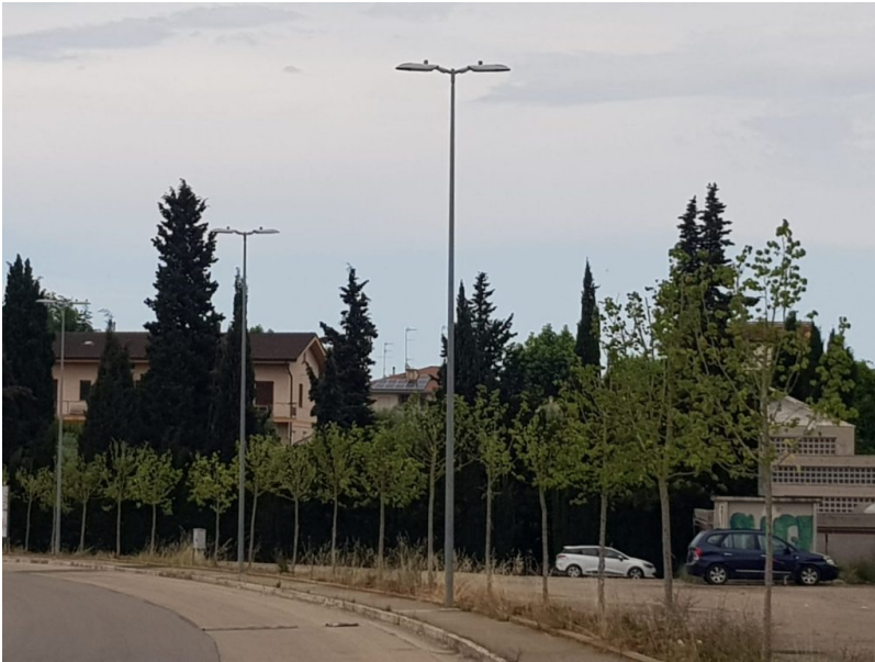
nuove essenze arboree in via Prato