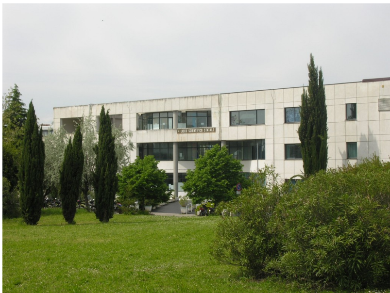
Attuale sede Liceo Scientifico Marie Curie di Giulianova.