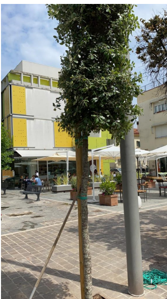
lecci via nazario sauro (2)

Venti nuovi alberi sono stati piantati, questa mattina, su via Prato, nei pressi del cimitero monumentale di Giulianova. Si tratta di essenze arboree del tipo tilia cordata . Nei prossimi giorni, invece, si procederà alla messa a dimora di quindici nuove gleditsie a Case di Trento. Nonostante le oggettive difficoltà, dovute anche alla carenza di unità lavorative, continua l'azione dell'amministrazione comunale a sostegno dell'ambizioso progetto di arricchire la città di un numero sempre maggiore di piante. Anche il verde pubblico di via Nazario Sauro è stato arricchito, in questi giorni di, tre nuovi lecci, uno dei quali regalato alla città da un gruppo di bambine, mentre altri due frutto delle donazioni al progetto "Regala un albero" dell'associazione Co.n.al.pa Giulianova, in collaborazione con la Giulianova Patrimonio e l'Ente comunale, nato con l'obiettivo di incrementare il patrimonio arboreo cittadino, a cui stanno aderendo tantissimi cittadini, aziende, enti ed associazioni del territorio. Ha aderito personalmente al progetto anche il sindaco Jwan Costantini, che a nome della famiglia e in memoria del padre Rizzardo, ha voluto donare alla città uno dei lecci messi a dimora in via Nazario Sauro.