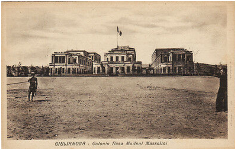
Una delle sedi storiche all'interno della Colonia Marina "Rosa Maltoni Mussolini"