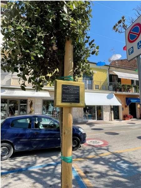
lecci via nazario sauro

Venti nuovi alberi sono stati piantati, questa mattina, su via Prato, nei pressi del cimitero monumentale di Giulianova. Si tratta di essenze arboree del tipo tilia cordata . Nei prossimi giorni, invece, si procederà alla messa a dimora di quindici nuove gleditsie a Case di Trento. Nonostante le oggettive difficoltà, dovute anche alla carenza di unità lavorative, continua l'azione dell'amministrazione comunale a sostegno dell'ambizioso progetto di arricchire la città di un numero sempre maggiore di piante. Anche il verde pubblico di via Nazario Sauro è stato arricchito, in questi giorni di, tre nuovi lecci, uno dei quali regalato alla città da un gruppo di bambine, mentre altri due frutto delle donazioni al progetto "Regala un albero" dell'associazione Co.n.al.pa Giulianova, in collaborazione con la Giulianova Patrimonio e l'Ente comunale, nato con l'obiettivo di incrementare il patrimonio arboreo cittadino, a cui stanno aderendo tantissimi cittadini, aziende, enti ed associazioni del territorio. Ha aderito personalmente al progetto anche il sindaco Jwan Costantini, che a nome della famiglia e in memoria del padre Rizzardo, ha voluto donare alla città uno dei lecci messi a dimora in via Nazario Sauro.