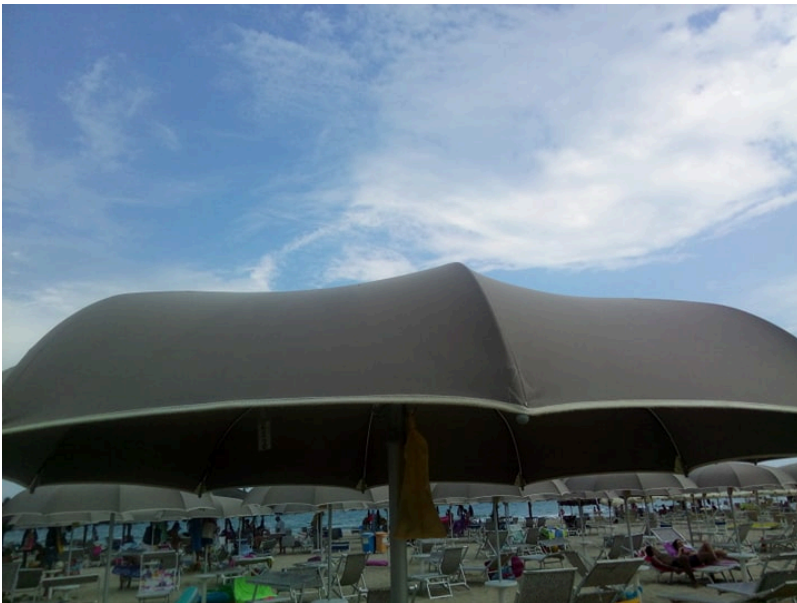
Mare Spiaggia Giulianova Lido

I recenti campionamenti effettuati dall'ARTA, nella giornata di lunedì 14 giugno 2021, hanno dato esito favorevole per tutti i parametri, attestando quindi la buona qualità delle acque di balneazione del litorale giuliese. Dalle risultanze analitiche, infatti, relative al campionamento delle recenti analisi, i parametri microbiologici risultano conformi alle normative in tutti i punti di prelievo.