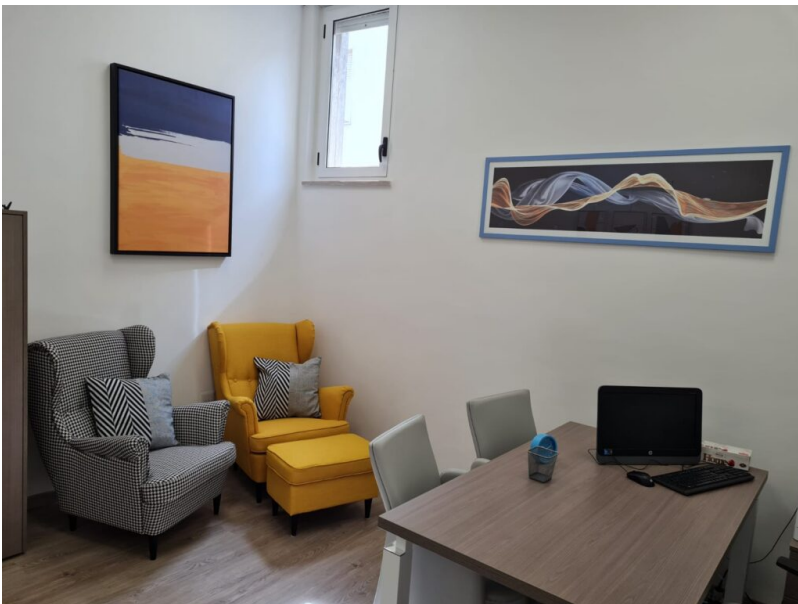
Le terre del sole Giulianova