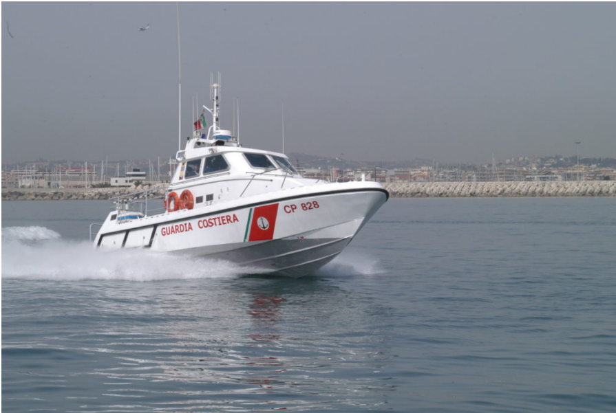
Guardia Costiera 2020.

Come preannunciato, sono stati svolti ulteriori controlli in materia di pesca da parte delle Guardia Costiera di Giulianova, che nei giorni appena trascorsi hanno interessato le unità da pesca nel corso della loro attività in mare.