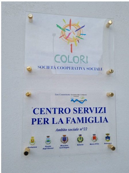
Le terre del sole Giulianova