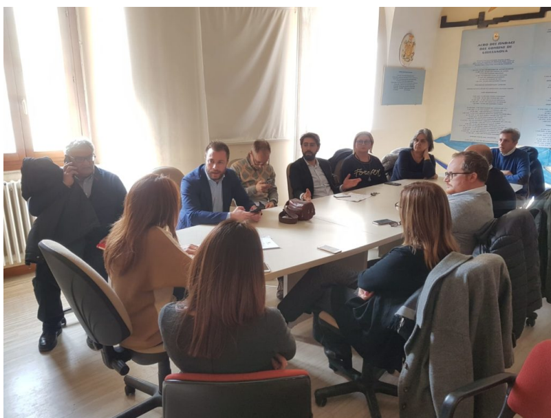
Conferenza dei Sindaci Unione Le Terre del Sole.

Mercoledì 19 maggio , alle ore 10.00 , verrà inaugurata la nuova sede dell'Unione dei Comuni " Le Terre del Sole ", ubicata in via Galileo Galilei n. 83/91 a Giulianova Lido. Saranno presenti i sindaci e gli amministratori dei comuni dell'Unione.