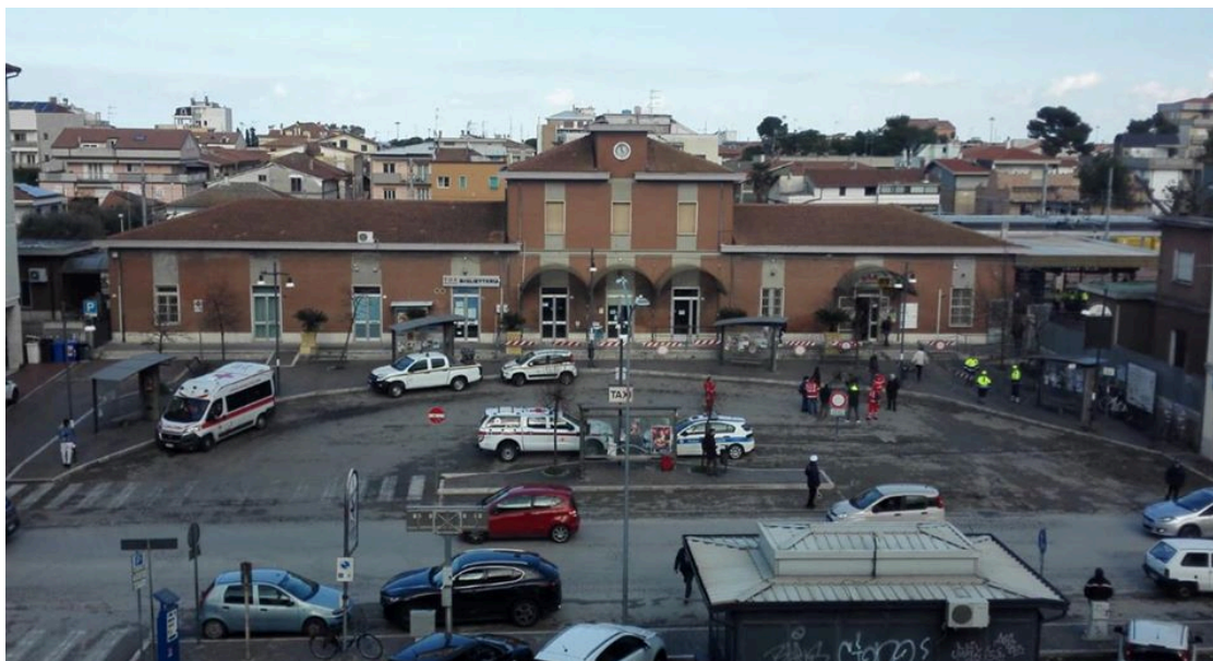
Stazione ferroviaria di Giulianova.