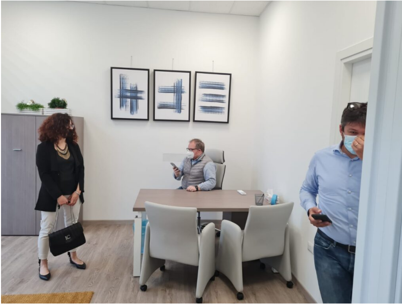
Le terre del sole Giulianova