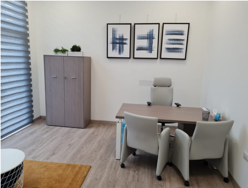
Le terre del sole Giulianova