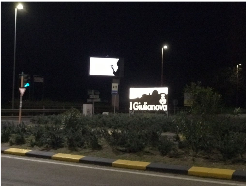
insegna luminosa di benvenuto bivio bellochio