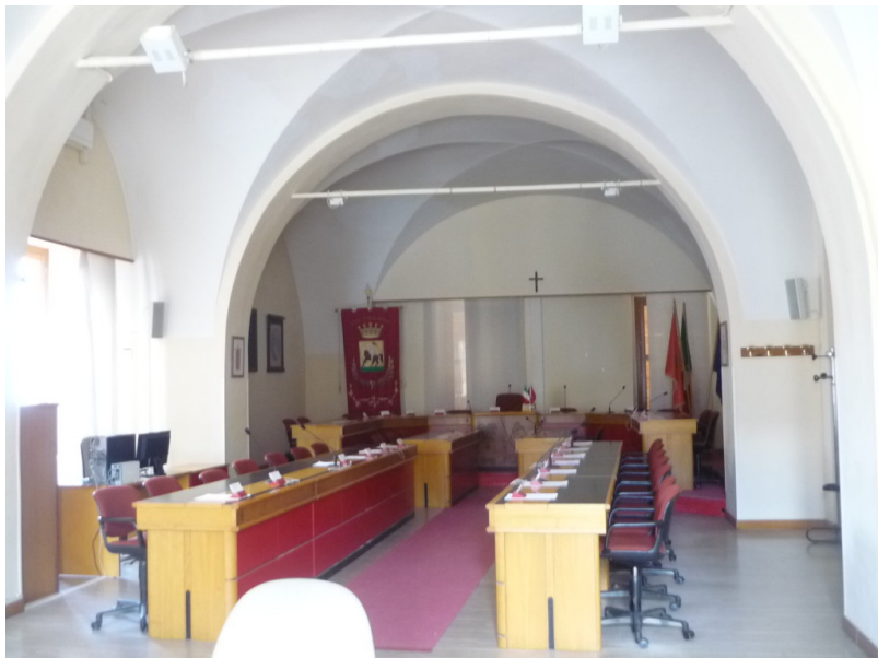
Sala consiliare del Comune di Giulianova

E' convocato il Consiglio Comunale per venerdì 23 aprile 2021, alle ore 17.30, nella Sala Consiliare del Palazzo Municipale di Giulianova (Corso Garibaldi, 109).