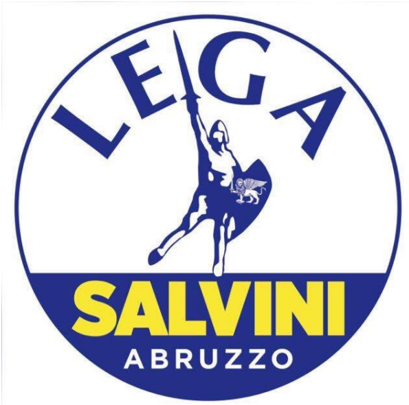
Lega Giulianova Abruzzo