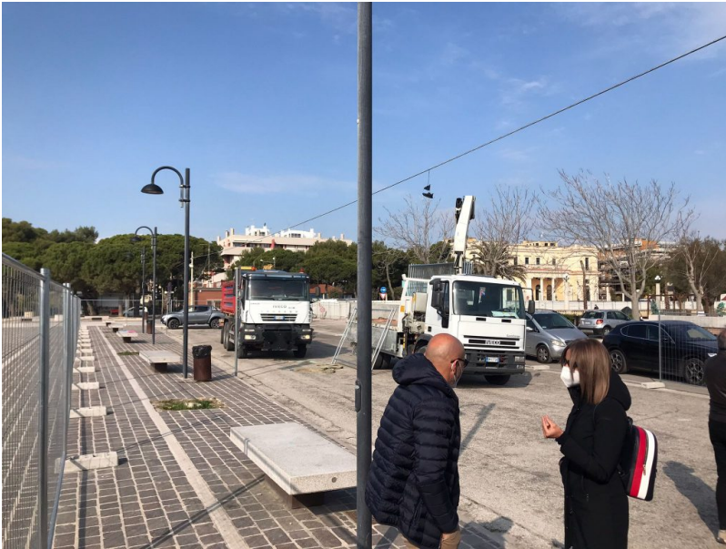
Inizio interventi piazza del mare