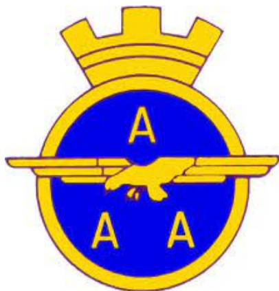
Logo Aeronautica associazione