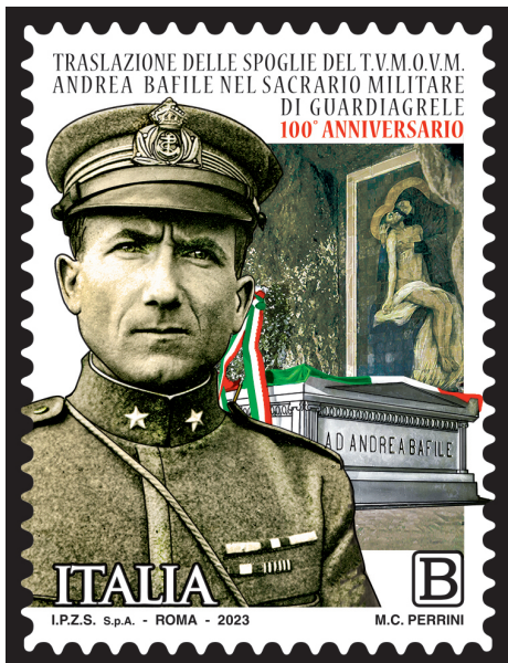
FRANCOBOLLO DEDICATO AD ANDREA BAFILE