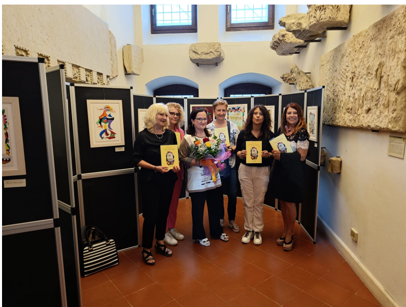
Un pomeriggio culturale memorabile quello trascorso sabato scorso 19 giugno 2023 al Museo Archeologico di Cividale del Friuli con la presentazione del volume Panismo a quattro mani della storica dell'arte Chiara Strozziere ove sono documentate