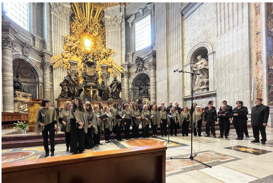
Coro Sine Nomine1_Basilica San Pietro_06 06 2024 (1)