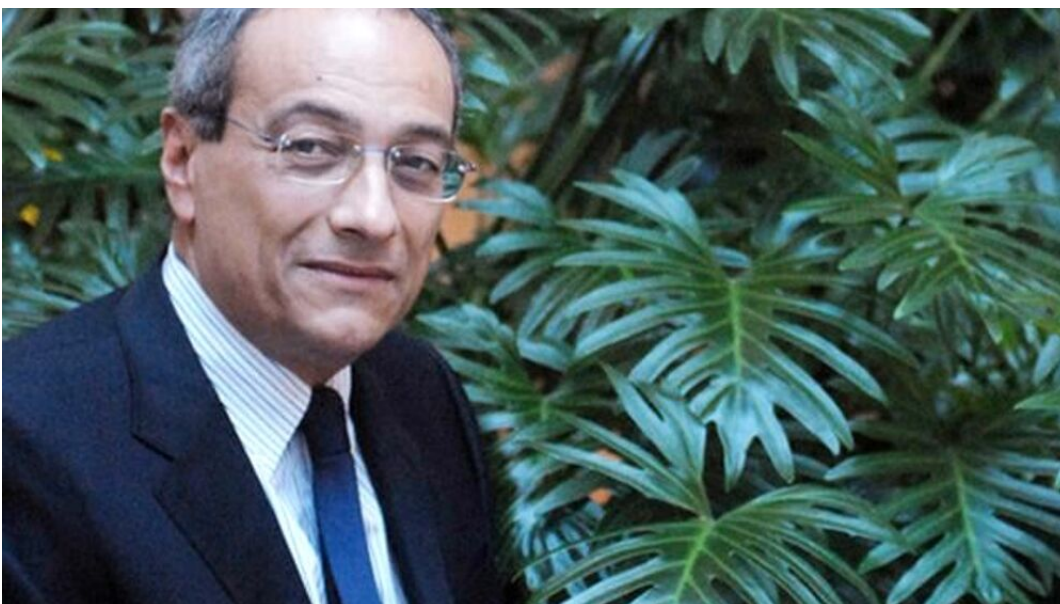
In Abruzzo la tre giorni con il nuovissimo lavoro Rizzoli "Ogni rancore è spento"