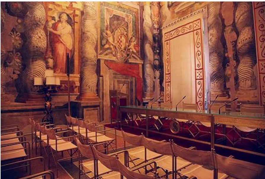
Senato, Sala Zuccari