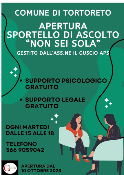
Il Guscio di Roseto degli Abruzzi