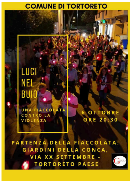
Il Guscio di Roseto degli Abruzzi