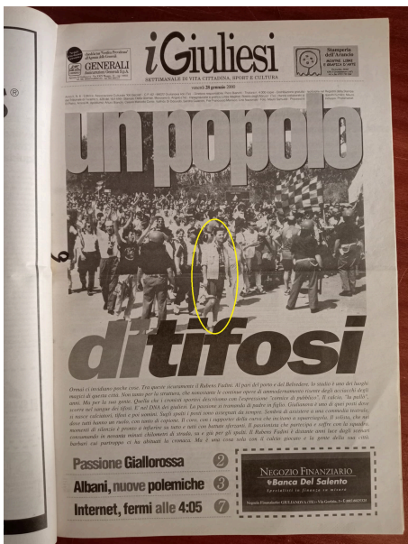
La prima pagine del settimanale "I Giuliesi"