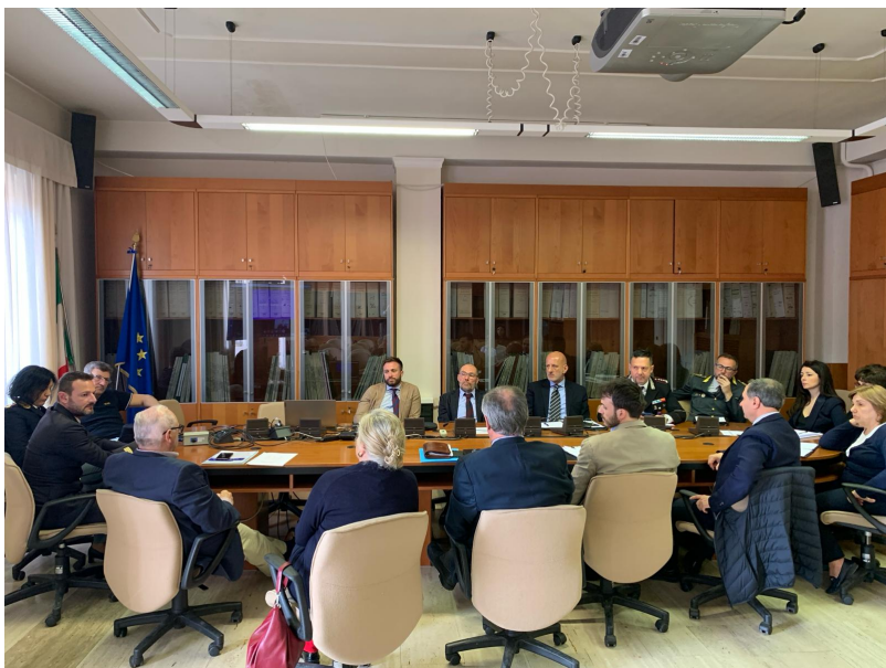
Comitato Freccie Tricolori in Prefettura

Stelo: "Grande occasione per la Provincia di Teramo e per Giulianova, saranno giornate di festa"