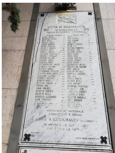
Monumento ai caduti Seconda Guerra Mondiale (cimitero di Giulianova)