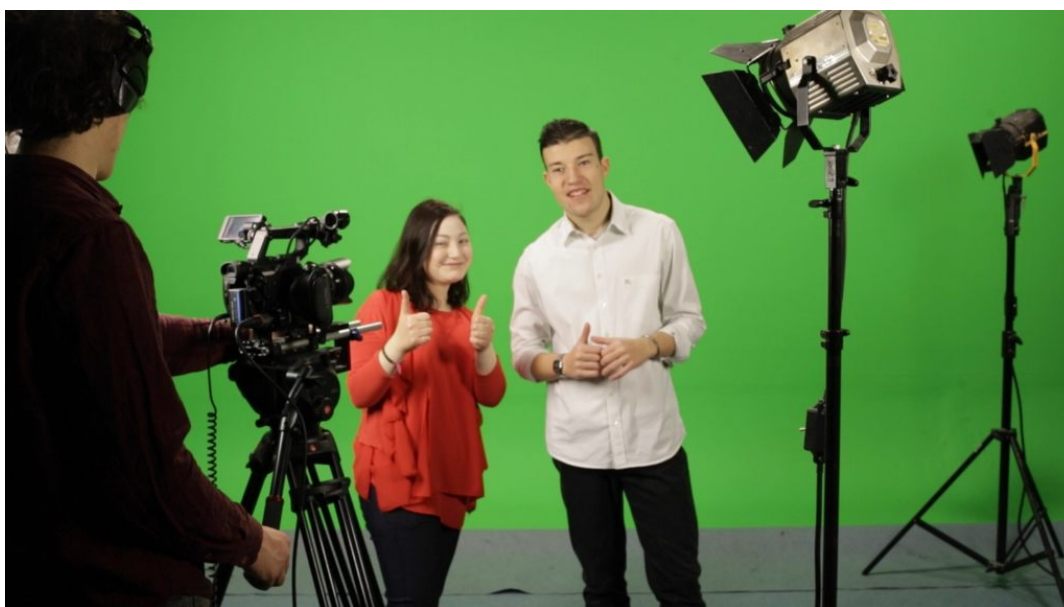
Uno Sguardo Raro 1 piccola

Prorogato al 18 novembre 2017 il bando di concorso per “Uno sguardo raro”, il festival di cinema dedicato alle malattie rare , alla sua terza edizione, che si terrà a Roma , presso la Casa del Cinema, il 10 e 11 febbraio 2018 , a ingresso gratuito .