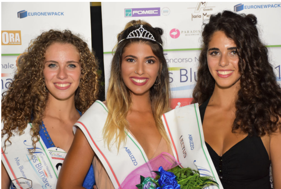
da sx 3a, 1a e 2a

Il folto pubblico che da due ore prima dell'inizio previsto già aveva preso posto sulle sedie messe a disposizione degli spettatori, ha potuto ammirare uno spettacolo di bellezza condito da esibizioni artistiche di alto livello emotivo.